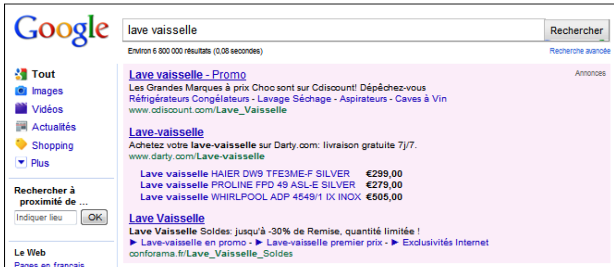
Exemple de produits affichés dans des annonces Google