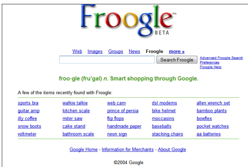
Froogle en 2004

Le positionnement de Google sur le commerce en ligne ne date pas d'hier : en 2002, le site Froogle est lancé pour le marché américain. Il s'agit d'un comparateur de prix, dont le nom est dérivé de l'adjectif "frugal", et dont le but est d'aider les internautes à trouver de bonnes affaires. En 2004, Froogle est même déployé sur les marchés anglais et allemand.